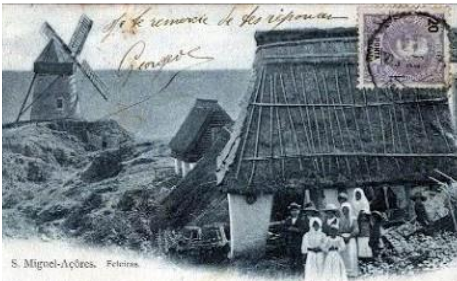
Fotografia do início do século XX do Moinho das Feteiras, num postal de correio.

Com o passar do tempo, o papel preponderante dos moinhos na economia de subsistência das populações deixou de se fazer sentir e, pouco a pouco, estes foram substituídos por mecanismos mais eficientes. Mas a estes moinhos aguardava os outros destinos, tendo vindo gradualmente a ser convertidos em museus demonstrativos da engenharia ou de visita como forma de contemplar o seu passado histórico. Neste último, enquadra-se a sua utilização para fins turísticos dada a beleza da sua construção.